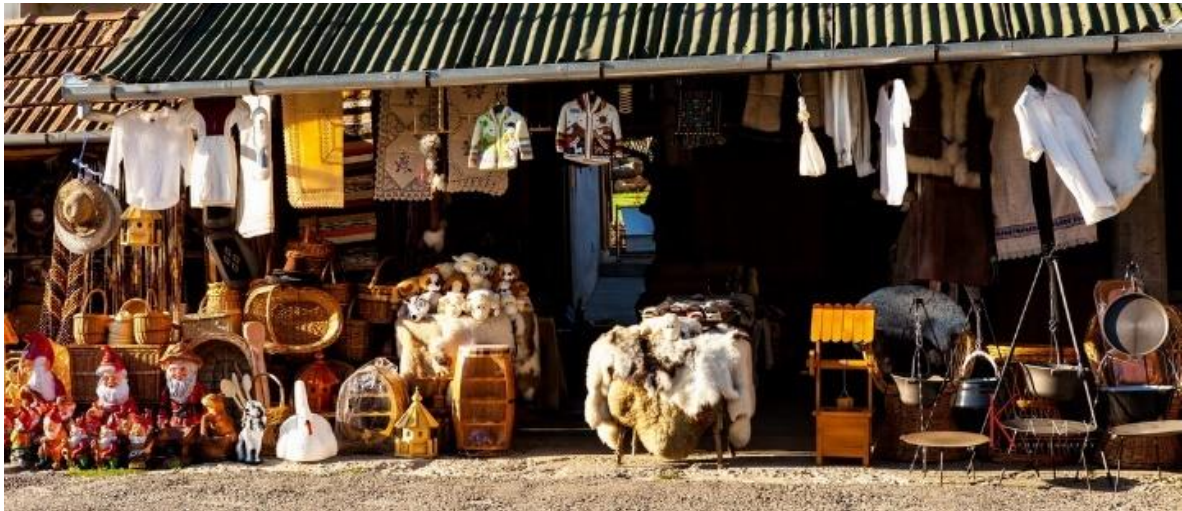
Fig.4. Strada Trandafirilor, Huedin, Cluj, 2016.