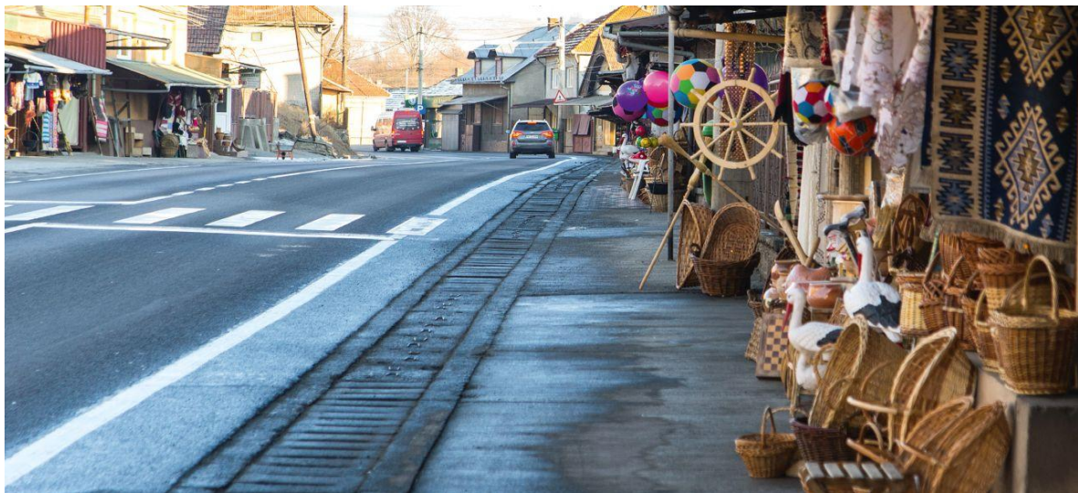
Fig.3. Strada Trandafirilor, Huedin, Cluj , 2016.